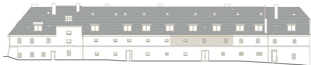
budova A (jižní křídlo) – pohled z ulice