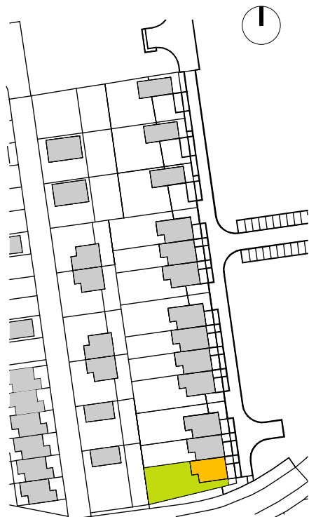
SCHÉMA UMÍSTĚNÍ V LOKALITĚ